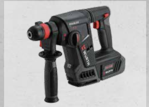
ΚΡΟΥΣΤΙΚΟ ΔΡΑΠΑΝΟ ΜΠΑΤΑΡΙΑΣ ABH 18 COMPACT M-CUBE®