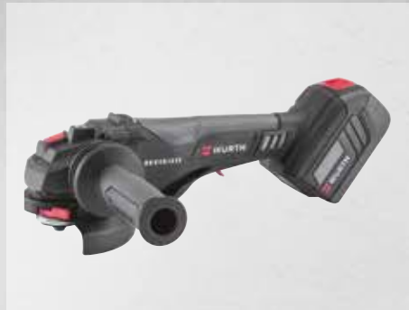
ΓΩΝΙΑΚΟΣ ΛΕΙΑΝΤΗΡΑΣ ΜΠΑΤΑΡΙΑΣ AWS 18-125 P COMPACT M-CUBE®