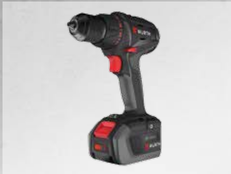
ΔΡΑΠΑΝΟΚΑΤΣΑΒΙΔΟ ΜΠΑΤΑΡΙΑΣ ABS 18 COMPACT M-CUBE®

Πρακτικό σετ 3 εργαλείων μπαταρίας 18 V M-CUBE® σε τσάντα, για καθημερινή χρήση