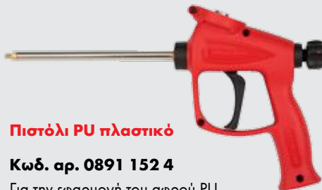
Πιστόλι PU πλαστικό