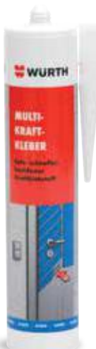
ΚΟΛΛΑ ΙΣΧΥΡΗ ΓΕΝΙΚΗΣ ΧΡΗΣΗΣ