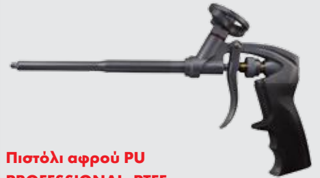
Πιστόλι αφρού PU PROFESSIONAL -PTFE

Για την επαγγελματική εφαρμογή του αφρού PU.