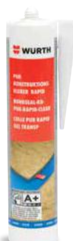
ΚΟΛΛΑ ΚΑΤΑΣΚΕΥΩΝ PUR RAPID