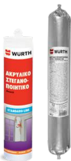
ΑΚΡΥΛΙΚΟ ΣΤΕΓΑΝΟΠΟΙΗΤΙΚΟ STANDARD LINE

Κατάλληλα για συναρμογές υλικών με απορροφητική (πορώδη) επιφάνεια σε εσωτερικούς και εξωτερικούς χώρους, όπως ανάμεσα σε παράθυρα και περβάζια, κάσες κουφωμάτων αλουμινίου, ξύλου ή PVC, ταβάνια, τοίχους, ρωγμές, κ.λπ. Κατάλληλα για γέμισμα αρμών που απαιτούν ελαστικότητα, χωρίς μεγάλη λειτουργική μεταβολή πλάτους. Ακατάλληλα για σφράγιση αρμών και συναρμογών μόνιμα εμβαπτισμένων στο νερό, όπως δεξαμενές, κ.λπ.