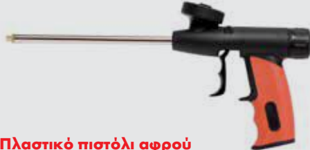
Πλαστικό πιστόλι αφρού PU ECO, κόκκινο/μαύρο