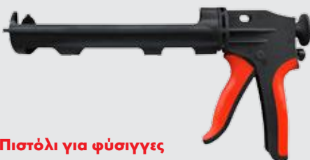
Πιστόλι για φύσιγγες 310 ml με χειρολαβή από PVC