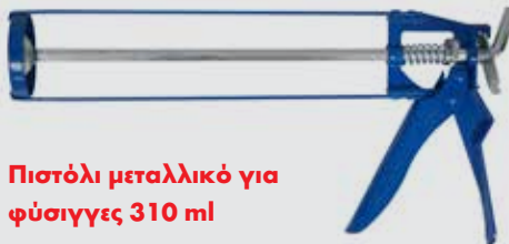
Πιστόλι μεταλλικό για φύσιγγες 310 ml