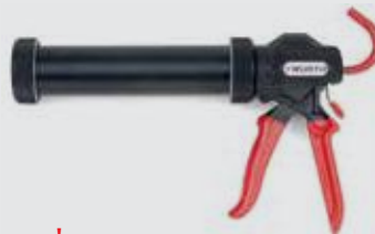
Πιστόλι χειρός σακούλας 300 ml

Κατάλληλο για χρήση με μεταλλικές και πλαστικές φύσιγγες.