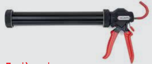
Πιστόλι χειρός σακούλας 600 ml